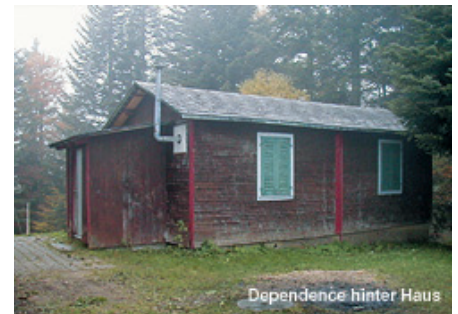
Dependence hinter Haus